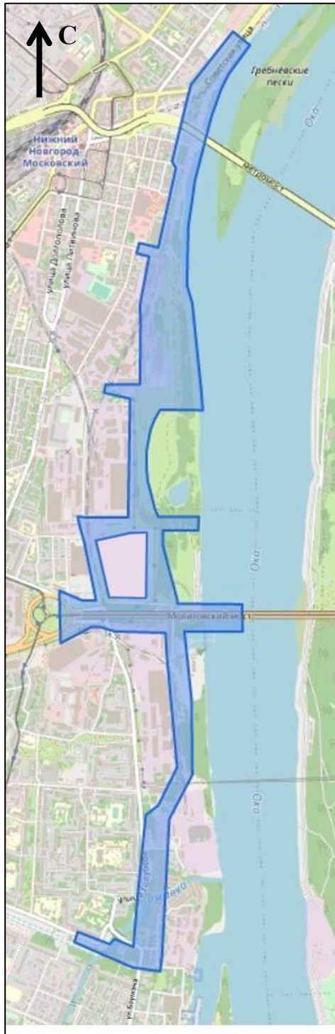
Схема границ подготовки документации по планировке территории (арх. № 104/23)

ПРИЛОЖЕНИЕ к приказу министерства градостроительной деятельности и развития агломераций Нижегородской области от 26 апреля 2023 г. № 06-01-02/47